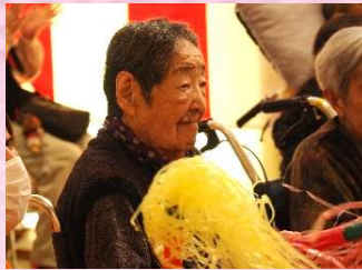
②眠りさえ忘れて踊りあかそうサンバビバサンバ